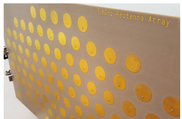
L'antenne Rectenna, utilisée au sol pour récupérer l'énergie envoyée de l'espace

Aujourd'hui, il existe différents standards de transmission d'énergie. On peut citer parmi eux Rezence , PMA ou encore le Qi principalement utilisé dans les smartphones. L'enjeu actuel est pour chacun de s'imposer comme le standard de référence.