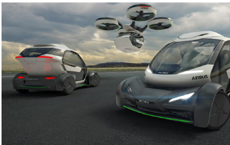
Ci dessus : projet de taxis drones proposés par Airbus. A droite : projet de taxis drones par Ehang à Dubaï

Les drones seront également utilisés pour transporter des personnes . Airbus et Italdesign ont présenté un projet de véhicule autonome utilisant un drone, Pop-Up . Il s'agit d'une capsule qui peut soit se déplacer sur les routes au moyen de roues, soit dans les airs , emportée par un drone, dès que le trafic devient trop important par exemple. Dans ce cas, dès que la capsule décolle, le châssis roulant rentre automatiquement à la base la plus proche. Les premiers essais en mouvement devraient se dérouler en fin d'année 2017.